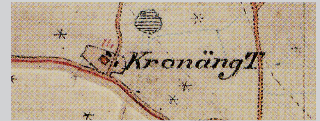
Röstorp – från röse till torp Kronäng – ett röse vid ett torp

Mot 1700-talets slut och framför allt under på 1800-talet, återkom dock bosättningen till höjderna i Röstorp – denna gång i form av jordlösa torpare som fick lov att bygga en enkel stuga och ta upp några åkertegar på skogen. Kronäng är ett bra exempel på detta! De små torpodlingarna hade dock föga gemensamt med de vidsträckta markområden som de forntida bönderna brukade.