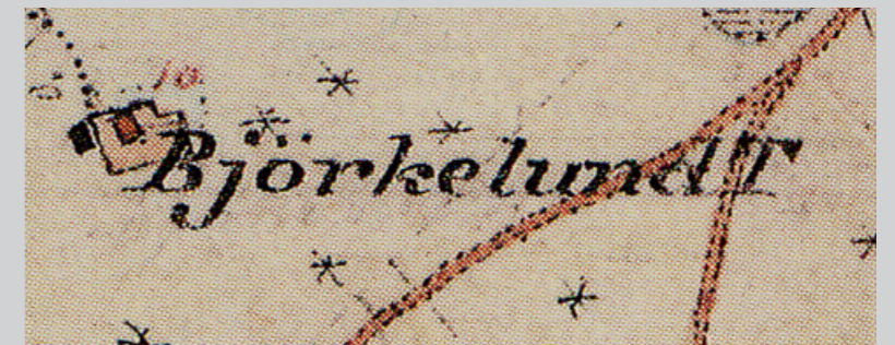
Björkelund på 1890–1897 års ekonomiska karta.

Resterna efter torpet Björkelund och delar av dess övergivna inägor. Remains of crofter's holding.