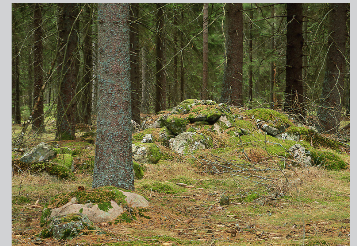
Innanför torpets inägo gräns finns toppiga rösen, typiska för torparnas odling. Crofter's clearance cairn.