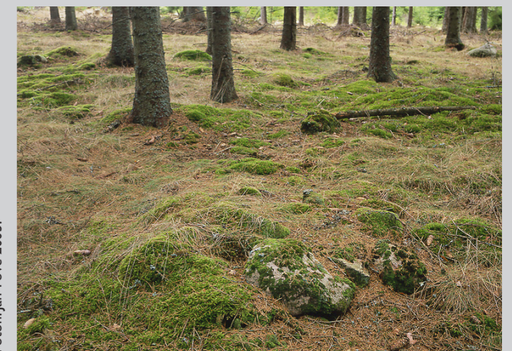
Strax utanför inägo gräns kan man iakttä flacka, förhistoriska röjningsrösen. Prehistoric clearance cairn.