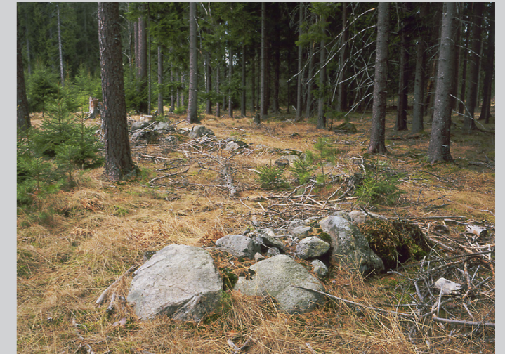
Resterna efter en låg stenmur visar gränsen mellan torpets inägor och utmark. Ruined stone wall at the border between infield and outland.

Hier in die Nähe von Kätners Platz Björklund, sieht man den Unterschied zwischen den vorgeschichtlichen Methoden grosse Flächen zu benützen und den intensiven Anbau der Kätner. Die Kätner des neunzehnten Jahrhunderts hatten nicht genügend Land um grössere Flächen anzubauen. Aus dem Anlass bearbeitete man kleine Felder, dungte sie kräftig und räumte viele Steine ab. Deswegen sind die Steinhaufen der Kätner viel grösser, weniger in der Anzahl und formrichtiger als die kleinen und flachen vorgeschichtlichen Mauern. Auf diesem Platz findet man die vorgeschichtlichen Steinhaufen neben den Haufen der Kätner!